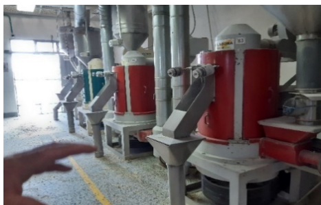
FOTO 7. TRILLADORAS