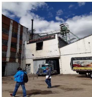
FOTO 1. FACHADA DEL PREDIO