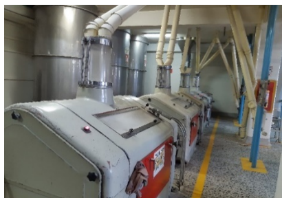
FOTO 3. BANCOS DE MOLIENDA