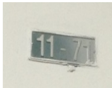
FOTO 2. NOMENCLATURA DEL PREDIO