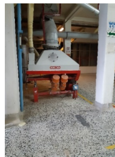
FOTO 6. CEPILLADORA DE MAIZ