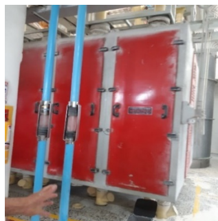
FOTO 5. CERNEDORA