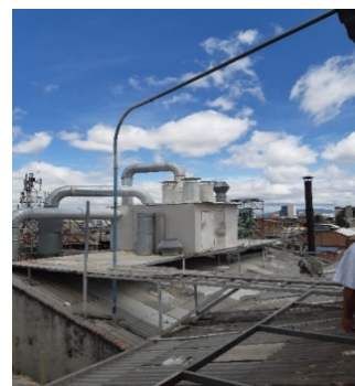
FOTO 12. DUCTOS