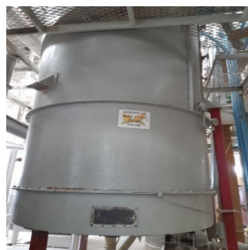
FOTO 10. FILTRO FAVINI