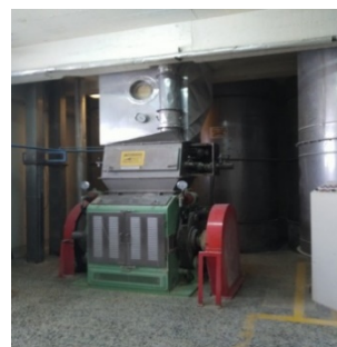
FOTO 4. COCCION DE MAIZ