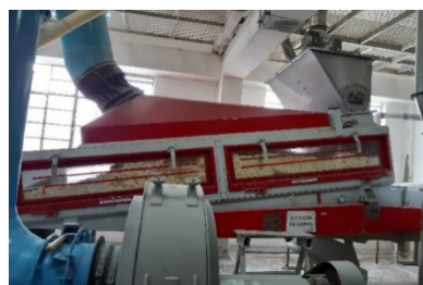
FOTO 8. SECADORA DE COPOS