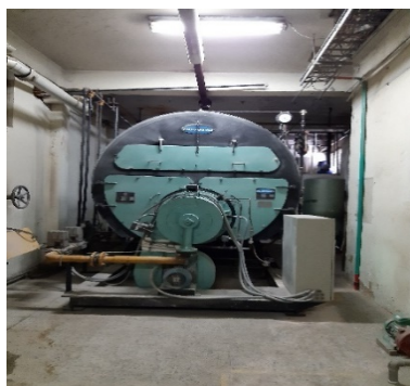
FOTO 11. CALDERA COLMAQUINAS 300 BHP