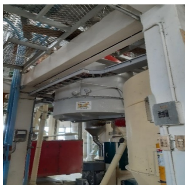
FOTO 9. FILTRO OCRIM